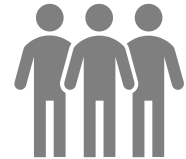
労働力としての人

労働力を供給する存在から、デジタルテクノロジーでお客様にプラスの価値を提供するシステムインテグレータへ進化。