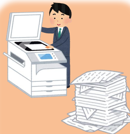
コピー代・用紙代