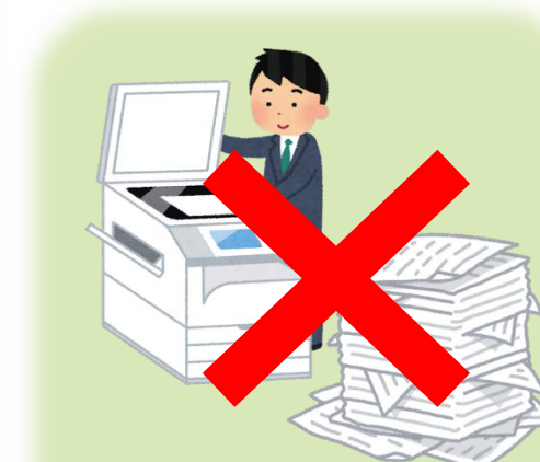
用紙代・コピー代の 費用削減