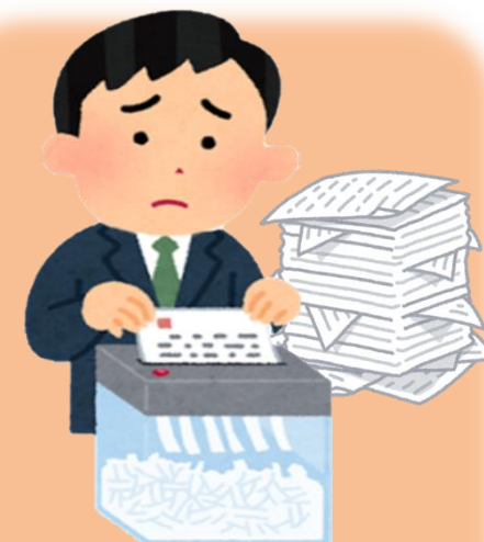
シュレッダーの手間