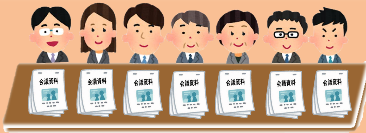
会議参加人数分の紙資料の配布