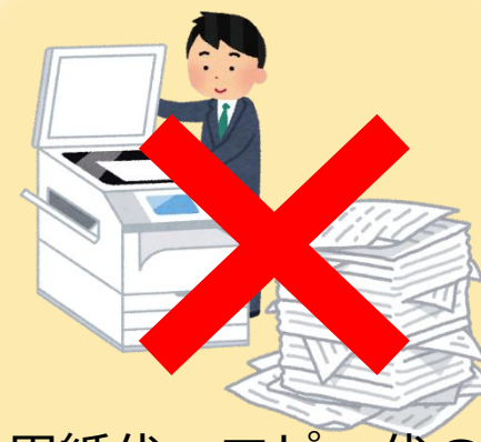
用紙代・コピー代の 費用削減