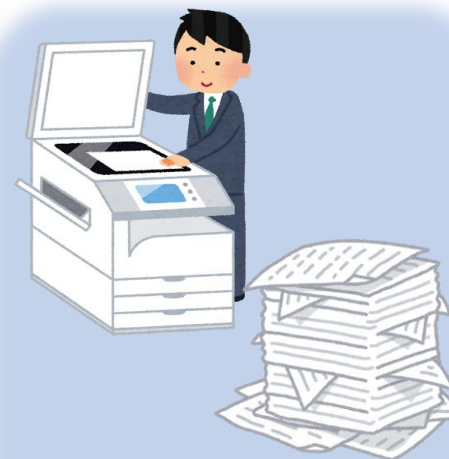
コピー代・用紙代