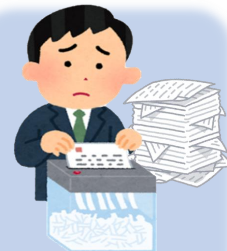
シュレッダーの手間